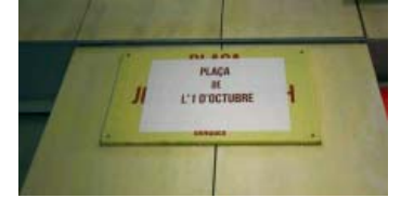
Sense acord per a la plaça de l'1-O | Roger Benet