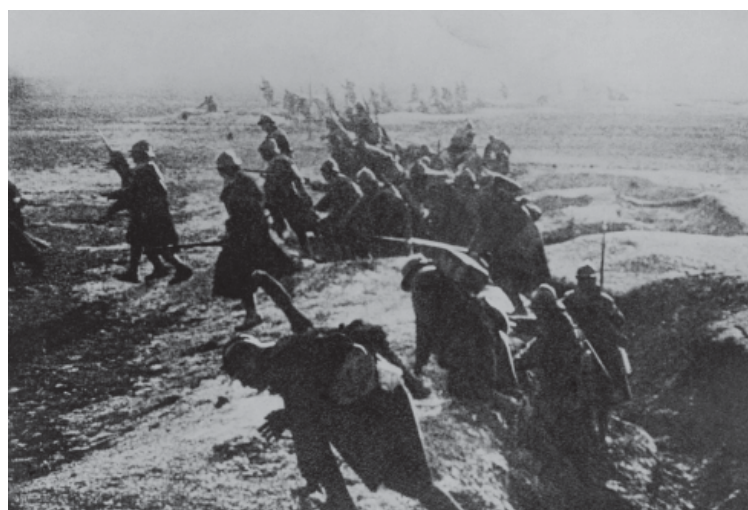
En marxa el programa recordatori de la Primera Guerra Mundial

A quest 2018 se celebra el centenari de la fi de la Primera Guerra Mundial. Per aquest motiu, diverses entitats volen posar de manifest la influència de la Gran Guerra a la nostra ciutat, ja que va ser un moment de gran producció manufacturera i cultural. "Sabadell en aquells anys és quan arriben més forces de la industrialització. Afecta el liberalisme, es comença a formar una societat de masses, apareix l'obrerisme i hi ha el ressorgiment