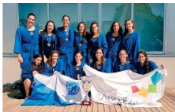
Imatge habitual per a les noies del Club | Roger Benet

10 de 10 del CNS femení a la Supercopa d'Espanya