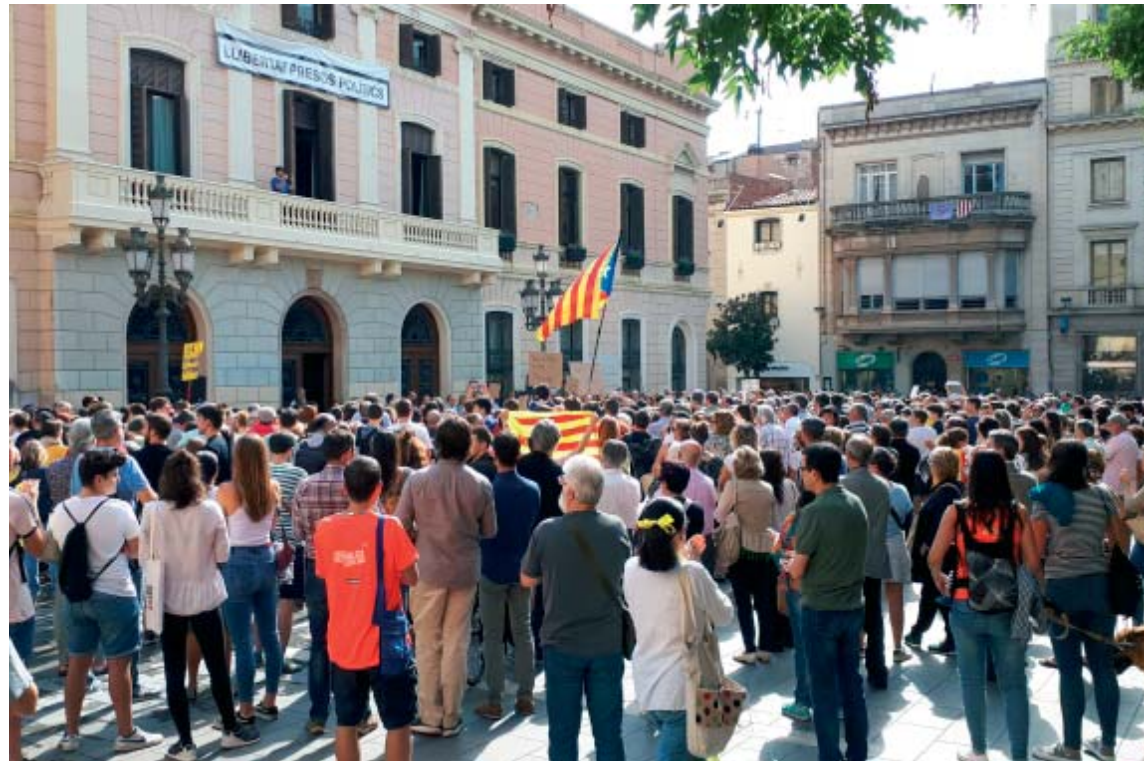
Concentració ciutadana davant de l'Ajuntament