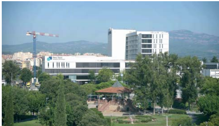
La direcció del Taulí espera reiniciar les obres en breu | Roger Benet

La Corporació Sanitària Parc Taulí és a punt d’adjudicar per segona vegada el projecte Frontal Gran Via, que preveu la construcció de dues plantes d’hospitalització noves a sobre del mòdul actual d’urgències per tal de poder descongestionar aquest servei en els moments de més pressió assistencial. El consell de govern de la institució va donar llum verda la setmana passada a la rescissió del contracte amb Acciona després que la companyia encarís el pressupost de les obres fins al 20 per cent de màxim que permet la llei i que a final d’agost s’aturesin els treballs. La necessitat del nou concurs endarrerirà l’entrada en servei dels 72 llits previstos per a malalts pendents d’ingressar a planta fins a l’estiu de 2020. El