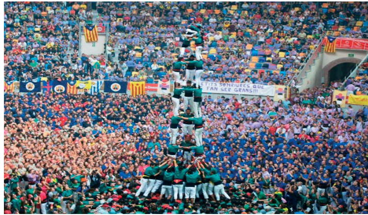
Els Saballuts tornen a la Tarraco Arena | Saballuts

Però els Saballuts no aniran sols cap a Tarragona. Tots aquells sabadellencs que són fans dels castells han tingut l'oportunitat d'assistir, durant aquesta setmana, a algun dels assaigs dels camises verdes i poder fer pinya en els castells. Tots aquests que hagin ajudat als Saballuts aquesta setmana viatjaran diumenge amb la