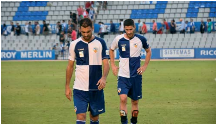
El Sabadell se la juga diumenge contra l'Espanyol B | Crispulo Díaz

cinc en tota la lliga. Aquest cop en van sis en sis jornades.