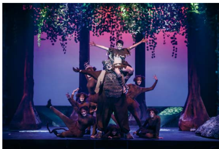
El llibre de la selva representat a Sabadell