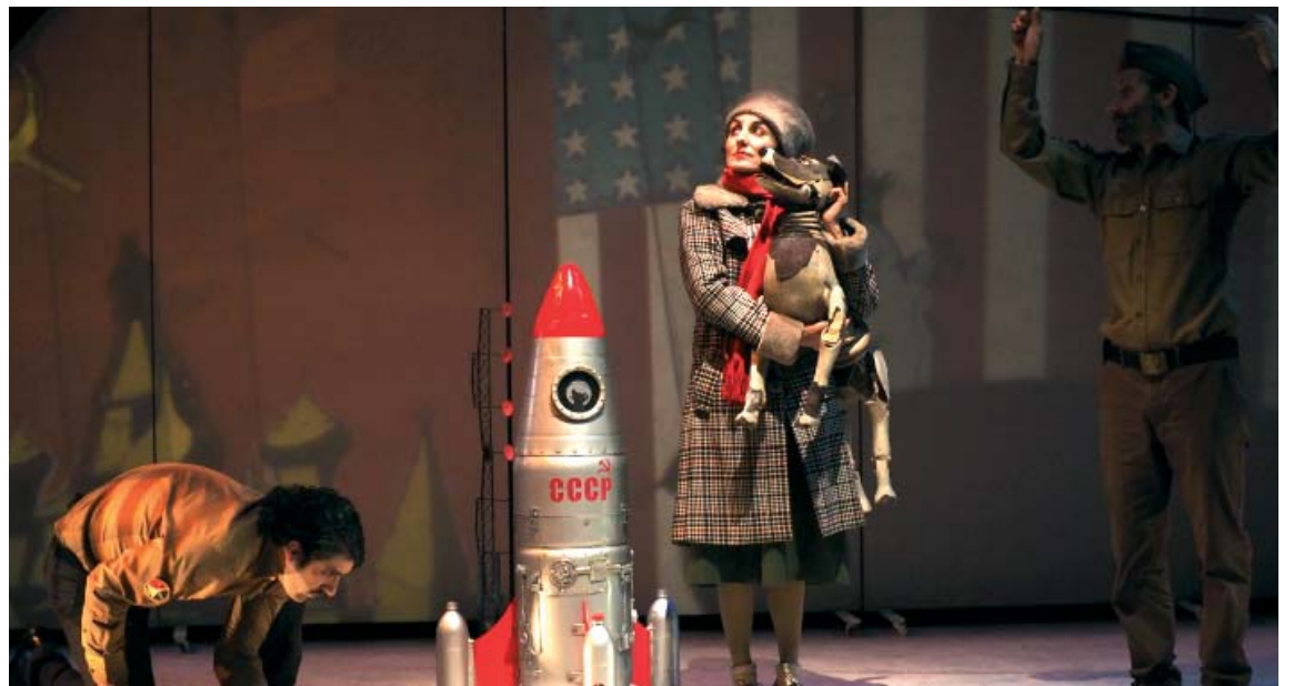
Laika és un dels espectacles programats a La Sala

i la dansa com el Rei de la casa , Amigoo o Wax , un muntatge sobre una matèria aparentment dòcil. Enguany, però, La Sala vol