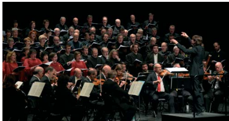
Aquest cap de setmana tornen els concerts de l'OSV | Roger Benet

Al novembre, el cinema torna a prendre el protagonisme quan es compliran 100 anys del naixement del compositor nordamericà Leonard Bernstein. La Simfònica el recordarà amb