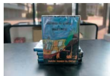
Imatge del DVD on es recull el documental del barri | Roger Benet

En aquesta jornada no hi van faltar personalitats polítiques. Joan