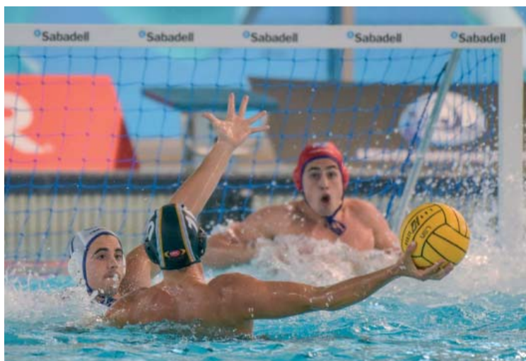
Els nois es van quedar a un gol de la següent fase | Roger Benet

El Sabadell havia caigut clarament (4-12) en la seva estrena contra el favorit de la lliga, l'Sport Management. Tot i superar 24 hores després el Potsdam alemany (18-8), l'empat entre italians i Terrassa obligava els