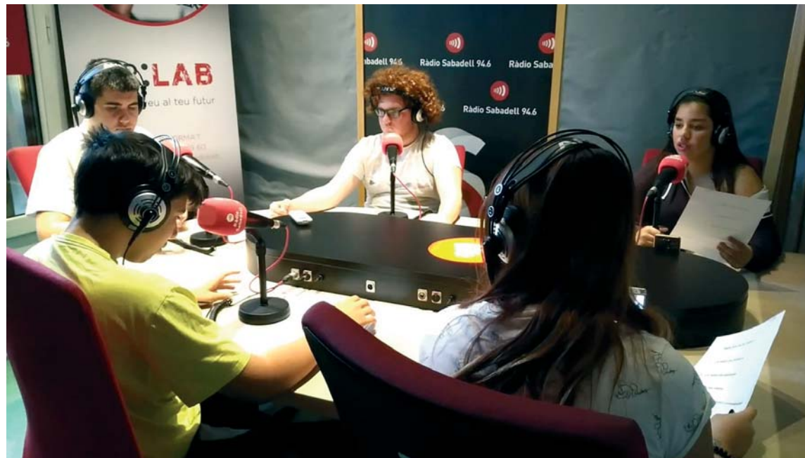
Grup d'estudiants de la Fundació Main a l'estudi de Ràdio Sabadell | MPC

d'elaboració dels diversos continguts com ara les notícies pels butlletins horaris o els programes informatius. Així mateix, els alumnes coneixen els profes-