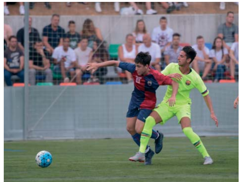
L'equip lluita per sortir de la zona de descens | Roger Benet

decisió. Un Fernández que no descarta tornar "algun dia", al Mercantil.