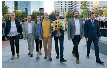
El Parc Catalunya tornarà a acollir els actes de la Diada