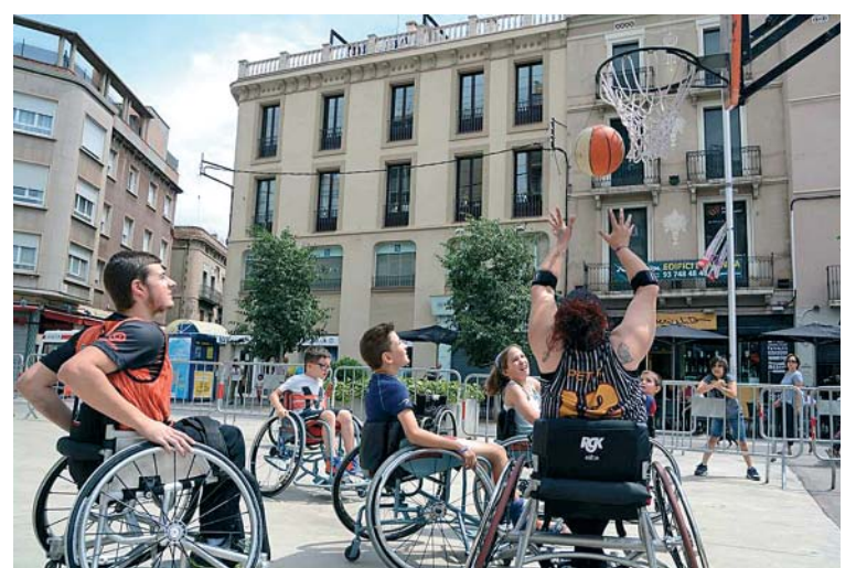
La Creu Alta acollirà la Festa del Bàsquet | Roger Benet

ció de la Festa del Bàsquet. Una jornada que s'allargarà fins a la 1 de la matinada i en què, gràcies a les tres entitats organitzadores – GlobalBasket, Creu Alta Sabadell Bàsquet i La Balles – s'instal·laran pistes de bàsquet per sensibilitzar i donar altaveu al bàsquet amb cadira de rodes. La Festa del Bàs-