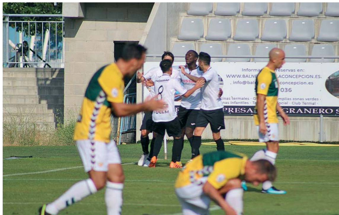
El Sabadell va encaixar a Conca la primera derrota de la temporada | UB Conquense

“Canviarem segur la nostra dinàmica i aquest partit és molt