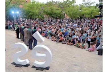
El tret de sortida de la Festa Major a Can Rull