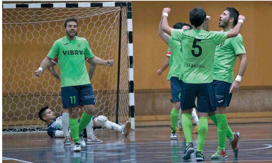
Cita històrica pels nois de la Pia