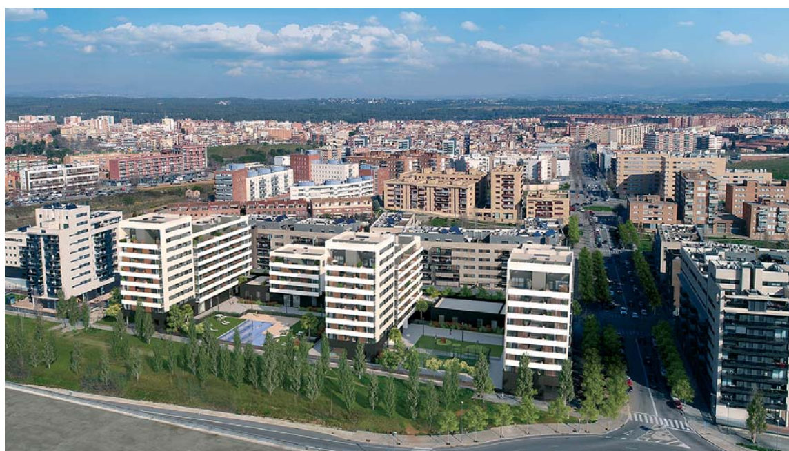
Vista aérea de cómo serán los edificios de la promoción de Jardins de Castellarnau de AEDAS Homes en Sabadell

De momento, en los aspectos esenciales, sí. El factor clave está en la política de financiación de los bancos, tanto a promotores como a particulares. Mientras que continúe el control de los ratios de endeudamiento y la exigencia de preventas a las promotoras, no veo riesgo de burbuja. Si esto se mantiene a largo plazo, veremos ciclos inmobiliarios más estables.