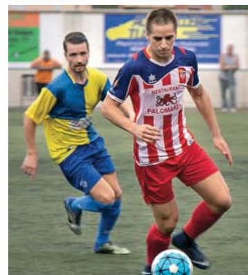
Els del nord no van poder amb el Vilassar a l'estrena | Marc Ortín

El Sabadell Nord ha debutat a la Primera Catalana amb un resultat negatiu. Derrota 0-2 contra el Vilassar de Mar. Això, però, no deslluïx l'estrena històrica de l'equip de la zona nord en la màxima categoria assolida mai fins ara. Després del campionat de Segona aconseguit el passat mes de maig, l'estrena a Primera era el duel més esperat al barri. La derrota contra el Vilassar es pot explicar per molts motius. El migcampista dels de Ca n'Oriac, Kevin del Corral, ho