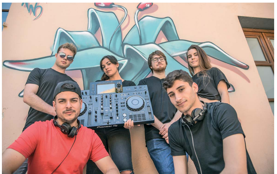
Equip del Vitamina Dance

bé les tertúlies" explica en Toni. Com a director de l'espai, s'ha encarregat al llarg de les noranta edicions energètiques de marcar la pauta rítmica del que ha de sonar, però també d'anar ampliant els formats de secció que podia oferir. I per això ha comptat amb