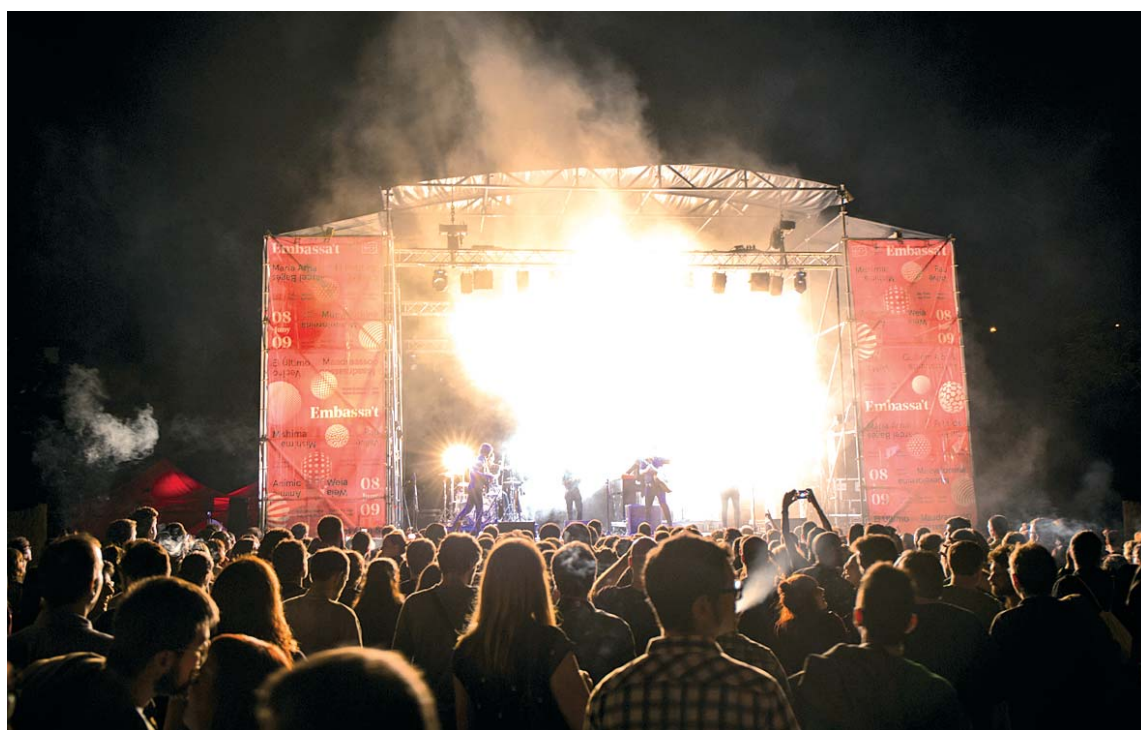
La millor música independent se cita avui i demà a Sabadell