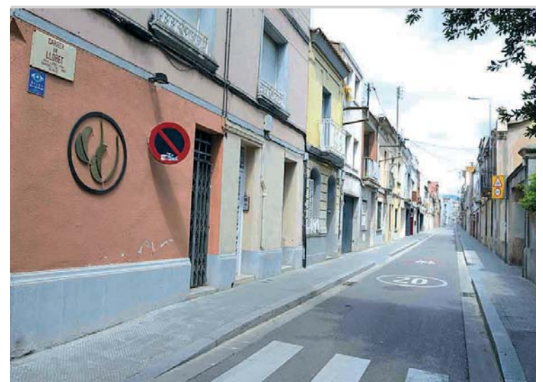
El carrer Llobet és una de les vies afectades per la pacificació del centre