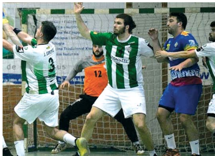
Els nois del Gràcia no van poder sorprendre el Sarrià | Oficial