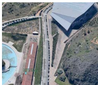
El nou espai ocupat per l'Embassa't

El festival d'enguany estrena una nova ubicació