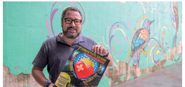
A més dels jugadors, tothom pot fer aportacions econòmiques