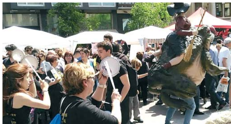
Les Bruixes del Nord posaran la cirereta a la Festa Major de Ca n'Oriac