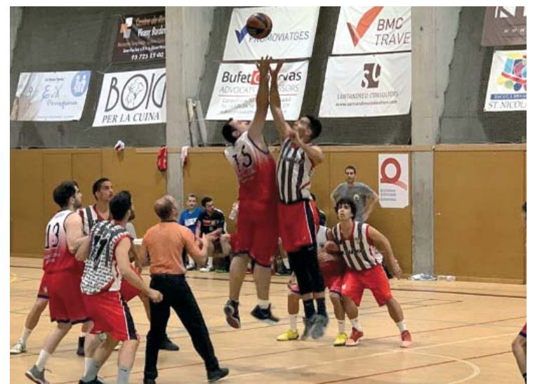
Mal sabor de boca final pels del carrer Jardí | Oficial

Els grana van caure a Cabrera (65-59) en el partit decisiu del playout